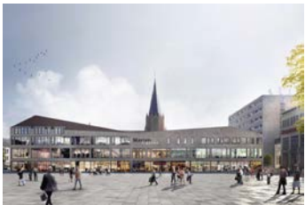
Neubrandenburg – im Bau