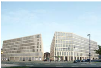
Bremen – im Bau