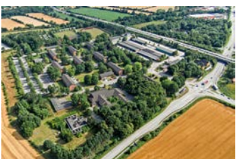
Gewerbepark - Konversion einer Bundesliegenschaft